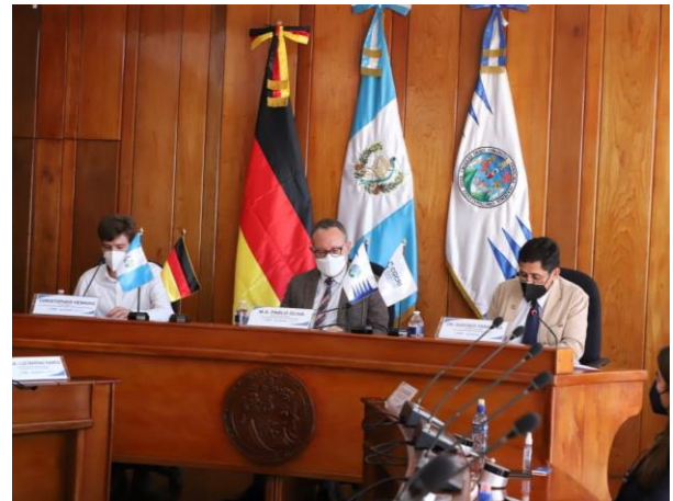
El primer encuentro en la USAC – Universidad de San Carlos de Guatemala.

¡Es fundamental NO aprender el idioma de forma aislada, sino combinarlo con los intereses personales! Además, sugiero que desháganse de su propio perfeccionismo. ¡Uno puede cometer errores!