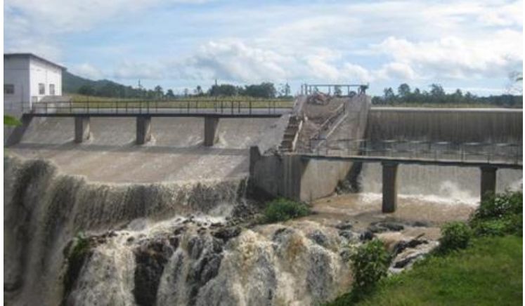
Impresionantes masas de agua en la pequeña central hidroeléctrica "La Esperanza".

Hacer que el intercambio internacional sea respetuoso con el clima: esta es una de las principales preocupaciones del proyecto de sostenibilidad del DAAD , que se aplica tanto a los programas de financiación del DAAD como a nuestra propia huella ecológica como organización. Los viajes de negocios desempeñan un papel importante en este sentido. La huella de carbono del DAAD muestra que los viajes de trabajo del personal en 2019 fueron responsables de casi una cuarta parte de las emisiones de gases de efecto invernadero en las operaciones comerciales del DAAD.